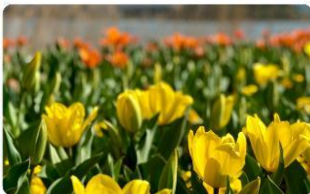
สวนโออิชิ ปาร์ค

สวนดอกไม้โออิชิ พาร์ค (Oishi Park) มหัศจรรย์แห่งวิวกุเอาไฟฟูจิ หนึ่งในจุดชมวิวของภูเขาไฟฟูจิที่สวยงามที่สุดอีกจุดหนึ่ง ที่จะเติมเต็มความสงบและความงดงามของธรรมชาติในญี่ปุ่นเมื่อไปเยือน คือสถานที่ที่ไม่ควรพลาด สวนดอกไม้โออิชิ พาร์ค (Oishi Park) แห่งนี้ไม่ได้เป็นเพียงสถานที่ที่มีดอกไม้สวยงามให้เราได้ชื่นชมแล้ว จุดเด่นของสวนนี้คือวิวกุเอาฟูจิที่อยู่เบื้องหลังสวนดอกไม้สีแสนสดใส ที่บานสะพรั่งในทุกฤดูกาล และยังเป็นมุมที่ให้เราได้สัมผัสกับวิวกุเอาฟูจิได้อย่างใกล้ชิด จากนั้นนำพาทุกท่านสู่..