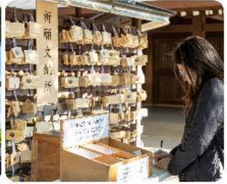
ศาลเจ้าเมจิจิงกู

ศาลเจ้าเมจิ หนึ่งในสถานที่อันศักดิ์สิทธิ์ใจกลางกรุงโตเกียว สิ่งแรกที่จะทำให้คุณประทับใจคือการเดินผ่านเสาโทริอิขนาดใหญ่ ระหว่างทางมีธรรมชาติที่ทำให้รู้สึกเหมือนก้าวเข้าสู่อีกโลกหนึ่งที่ได้เต็มไปด้วยความสงบ อีกทั้งยังสามารถเขียนคำอธิษฐานลงบนแผ่นไม้ "เอมะ" เพื่อขอพรสำหรับความสุขและความสำเร็จในชีวิตอีกด้วย จากนั้นนำพาทุกท่าน...ซ็อบปังกันต่อใจกลางกรุงโตเกียว เมืองที่เป็นศูนย์กลางของแฟชั่นและนวัตกรรม และเปิดประสบการณ์การซ็อบปังที่ไม่เหมือนใคร! สักรวจย่านต่างๆ ที่แต่ละแห่งที่มีเสน่ห์และเอกลักษณ์อันโดดเด่น เมืองที่เต็มไปด้วยชีวิตชีวาและความทันสมัยที่หลากหลายอย่าง ย่านฮาราจุกุ แหล่งรวมแฟชั่นที่แปลกใหม่และสดใส เดินเล่นบน Takeshita Street ที่เต็มไปด้วยเสื้อผ้าและเครื่องประดับที่ไม่ซ้ำใคร เพลิดเพลินกับบรรยากาศสุดคูลที่เป็นเอกลักษณ์