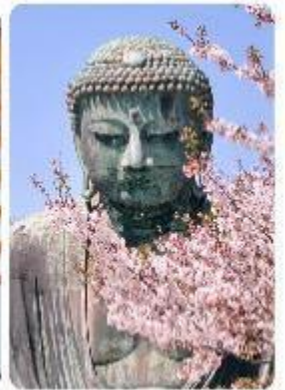
พระใหญ่ไดบุทสึ วัดโคโตคุอิน

จุดเด่นแห่งเมืองนี้คือ พระพุทธรูปองค์ใหญ่ไดบุทสึ (Daibutsu) หนึ่งในสัญลักษณ์ที่โดดเด่นที่สุดของ Kamakura พระพุทธรูปบรอนซ์ขนาดมหึมาที่วัดโคโตคุอิน (Kotoku-in) ที่มีความสูง 13.35 เมตร หนึ่งในพระพุทธรูปที่ใหญ่ที่สุดในญี่ปุ่น ไฮไลท์ของที่นี่คือการได้ชมความงามที่ตัดกันระหว่างพระพุทธรูปไดบุทสึขนาดใหญ่และต้นซากุระ ซึ่งปลูกอยู่ทั้งด้านหน้าและด้านหลังของพระพุทธรูป ทำให้เหมาะอย่างยิ่งกับการเดินเล่นและชมซากุระในบริเวณวัด เป็นอีกหนึ่งสถานที่ที่ต้องมาเยือนสักครั้ง หนึ่งในจุดไฮไลท์ของเมืองคามาคุระ คือ ไมโกลกันพาเอียน เกาะเอโนชิมะ (Enoshima) เป็นเกาะที่ตั้งอยู่ในจังหวัดคานากาวะ ประเทศญี่ปุ่น ซึ่งเป็นจุดหมายท่องเที่ยวยอดนิยมที่มีทิวทัศน์สวยงามและสถานที่ที่น่าสนใจมากมาย ทั้งชายหาด สวน และวิวทะเลที่งดงาม ในวันที่ท้องฟ้าโปร่งใสเรายังสามารถมองเห็นวิวของภูเขาไฟฟูจิได้อีกด้วย ด้านบนยังมี ศาลเจ้าเอโนชิมะ ที่มีความสำคัญในด้านความโชคดี โดยเฉพาะในเรื่องความรัก นอกจากนี้ยังมี หอคอยประภาคารเอโนชิมะ ที่ให้ทัศนียภาพ 360 องศา ของเมืองคามาคุระได้อีกด้วย