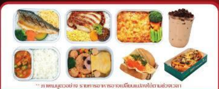
** ภาพเมนูตัวอย่าง รายการอาหารอาจเปลี่ยนแปลงได้ตามช่วงเวลา

ราคาขึ้นอยู่กับวันที่เดินทาง ** แจ้งพนักงานทุกครั้งก่อนทำการสั่งซื้อ