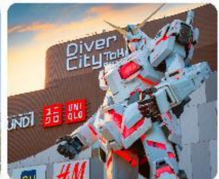
ย่านโอไดบะ ห้างไดเวอร์ซิตี ODAIBA SEASIDE PARK