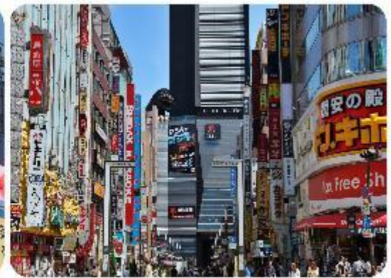
ช้อปปิ้งใจกลางกรุงโตเกียว - ชินจูกุ

นำพาทุกท่านเข้าสู่.. กรุงโตเกียว และช้อปปิ้งกันที่ใจกลางเมือง ชินจูกุ แหล่งรวมแฟชั่นและความบันเทิงย่านที่ไม่เคยหลับไหลและเต็มไปด้วยชีวิตชีวา และแหล่งช้อปปิ้งที่หลากหลาย เช่น Isetan และ Takashimaya ที่มีสินค้าหรูหราและแฟชั่นล่าสุด รวมถึงห้างสรรพสินค้าในตึกสูงอย่าง Tokyo Metropolitan Building เพลิดเพลินกับบรรยากาศที่สวยงามของ Kabukicho ซึ่งเป็นย่านบันเทิงที่มีร้านอาหารมากมาย นอกจากนี้ยังมี Golden Gai ซึ่งเป็นย่านบาร์เล็กๆ ที่มีเสน่ห์และบรรยากาศที่เป็นเอกลักษณ์ และมีแลนด์มาร์คถ่ายรูปที่โด่งดังอย่าง แมวยักษ์ 3 มิติ (Giant 3D Cat)