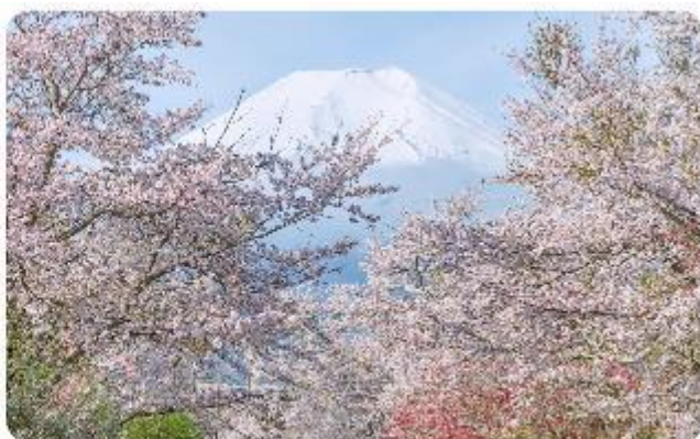
หมู่บ้านน้ำใสโอชิโนะ ฮักโก

โอชิโนะ ฮักโก หรือ ที่รู้จักกันในชื่อ หมู่บ้านน้ำใส ความงามแห่งธรรมชาติและวัฒนธรรมที่ซ่อนอยู่ใต้เงาภูเขาไฟฟูจิโอชิโนะ ฮักโก ตั้งอยู่ในหมู่บ้านโอชิโนะ จังหวัดยามานาชิ ประเทศญี่ปุ่น เป็นแหล่งน้ำธรรมชาติที่มีชื่อเสียง ประกอบด้วยบ่อน้ำใสสะอาดทั้งแปดแห่ง ซึ่งน้ำในบ่อเหล่านี้เกิดจากการละลายของหิมะและน้ำแข็งจากภูเขาไฟฟูจิ น้ำที่ไหลลงมานั้นได้ถูกกรองผ่านชั้นหินภูเขาไฟเป็นเวลาหลายปี จนทำให้น้ำในบ่อมีความบริสุทธิ์และใสจนเห็นถึงก้นบ่อ ไม่เพียงแต่ความงามของธรรมชาติที่ทำให้โอชิโนะ ฮักโกเป็นที่รู้จัก แต่ยังมีชื่อเสียงเกี่ยวกับวัฒนธรรมและประวัติศาสตร์ท้องถิ่นอย่างลึกซึ้ง หมู่บ้านนี้เป็นสถานที่